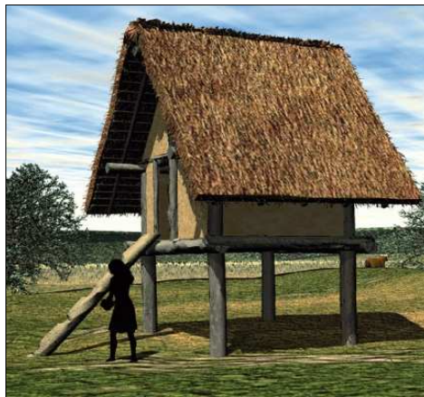
Reconstitution d'un grenier à blé.

Ils buvaient de la bière : la cervesoie.